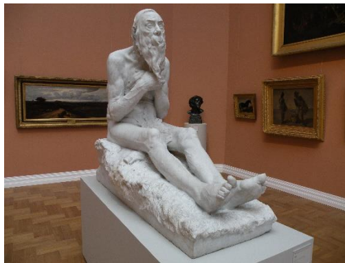
Job, Musée de Valenciennes