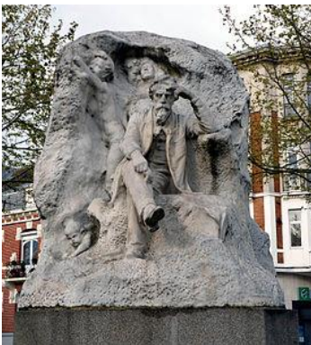
Jean-Baptiste Carpeaux, place Carpeaux

On peut voir d'autres œuvres de Félix Desruelles à Valenciennes. Par exemple :