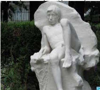
L'enfant prodige, square Plumecocq