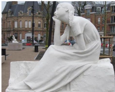
La jeune fille assise (reproduction), bd Watteau