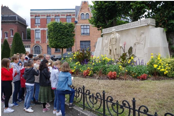
Les CM1-CM2 mènent l'enquête